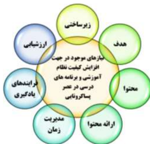
شکل ۱. مدل نهایی و مفهومی پژوهش

در شکل زیر تصویر کلی از نتایج تحلیل کیفی داده ها نشان داده شده است.