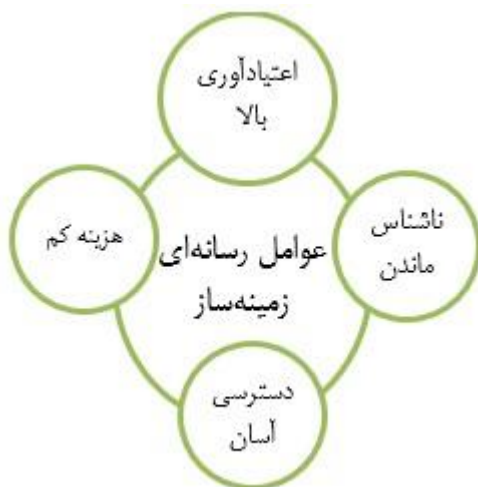
مدل مفهومی عوامل رسانه‌های زمینه‌ساز بروز خیانت اینترنتی